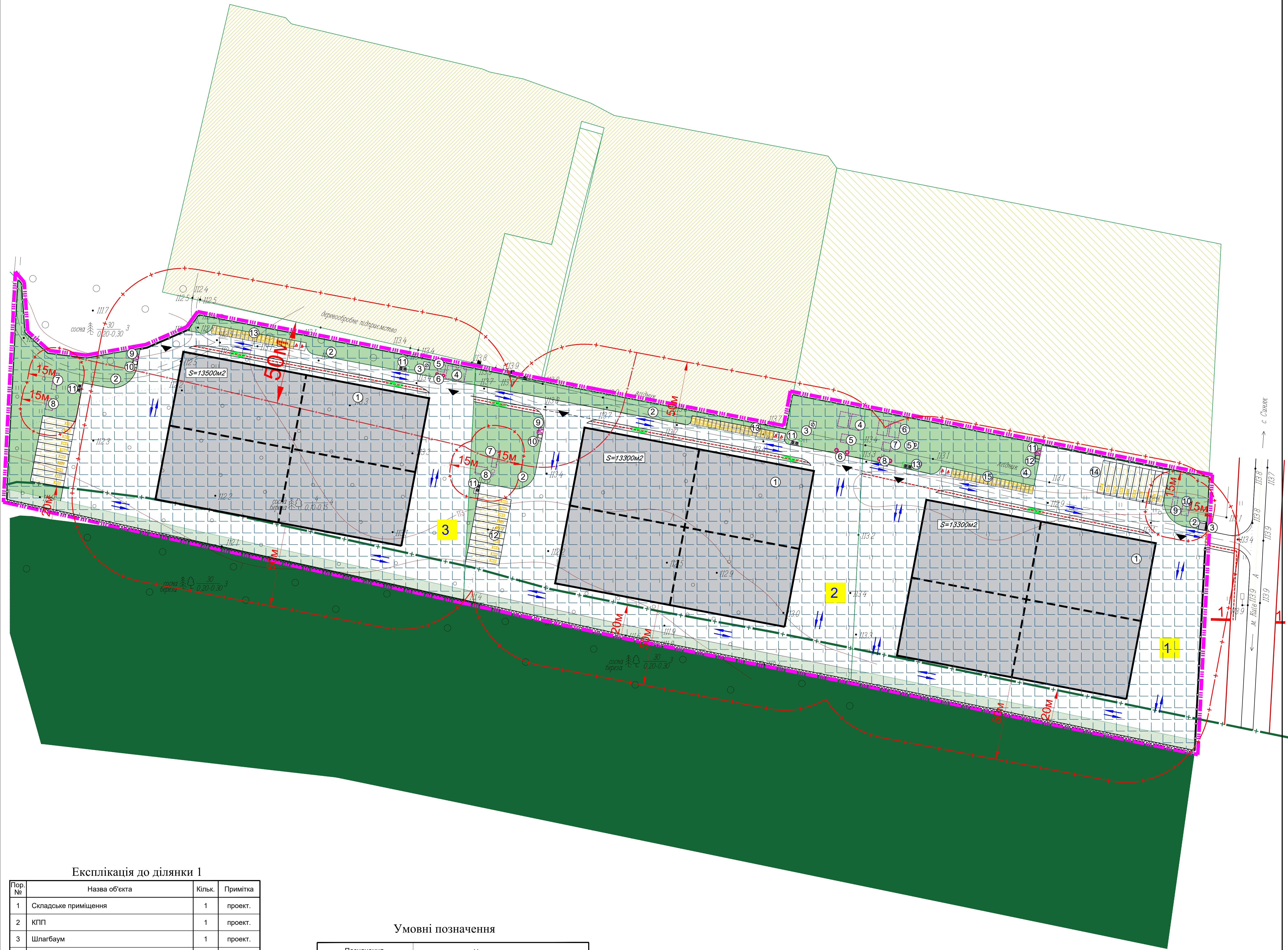
Експлікація до ділянки 1

Проектний план та Схема проектних обмежень у використанні земель поєднаний зі Схемою транспортної мобільності та інфраструктури М 1:1000 та Кресленням поперечних профілів вулиць М 1:200