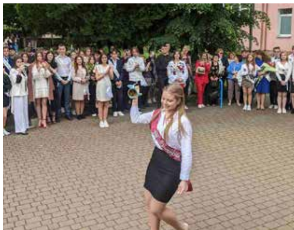
Закінчення на стор. 7.

Останній дзвоник – радісний і сумний водночас. Для першачків – це щастя ще непізаного смаку навчання та шкільної дружби, а для випускників, а їх у цьому році в Бучанській громаді 373 – прощання з дитинством.