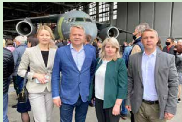
Закінчення на стор. 2.

Велика родина ДП «Антонов» святкує ювілей, що зібрав керівників держави, ветеранів підприємства, колектив, гостей, аби згадати славу історію світового лідера авіабудування.